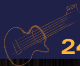
Banda Cittadina di Buja