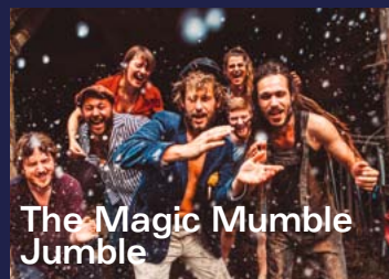
The Magic Mumble Jumble