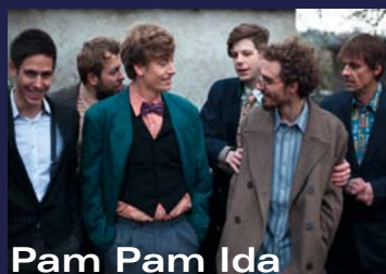
Pam Pam Ida